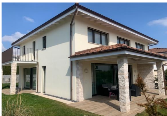
Ansicht südwest mit ged. Balkonterrassen süd und west

Grundstück Nr. 343J, Kiebitzstrasse 64, 8645 Jona (Stadt Rapperswil-Jona) 4 1/2- bis 5-Zimmer-Einfamilienhaus mit PW-Doppelgarage