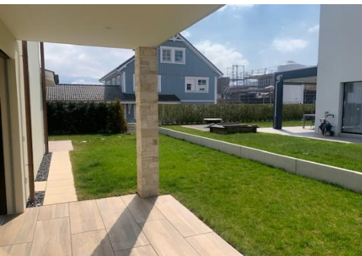
gedeckter Sitzplatz west