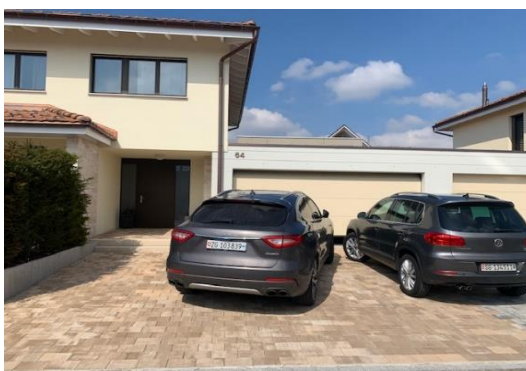
Vorplatz / PW-Doppelgarage