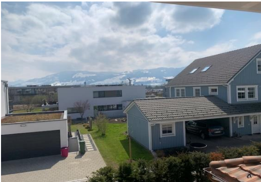
Aus- und Fernsicht süd