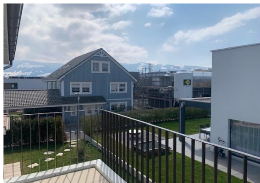
Balkonterrasse west mit Aus- und Fernsicht südwest