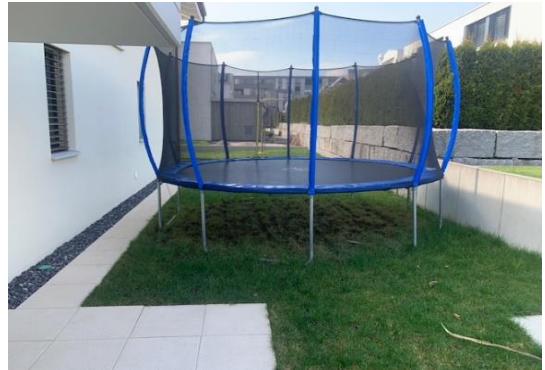
Garten / Umschwung nord