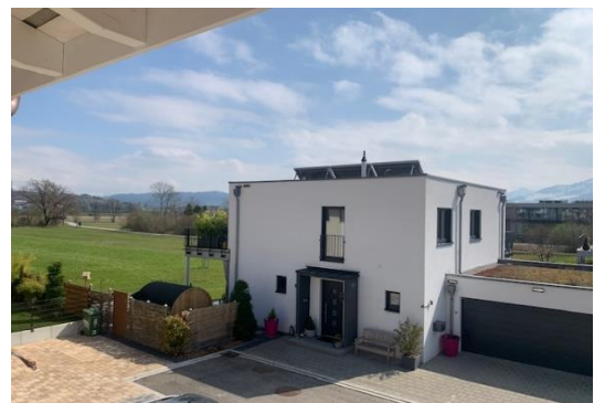
Aus- und Fernsicht südost