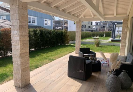
gedeckte Sitzplatzterrasse süd